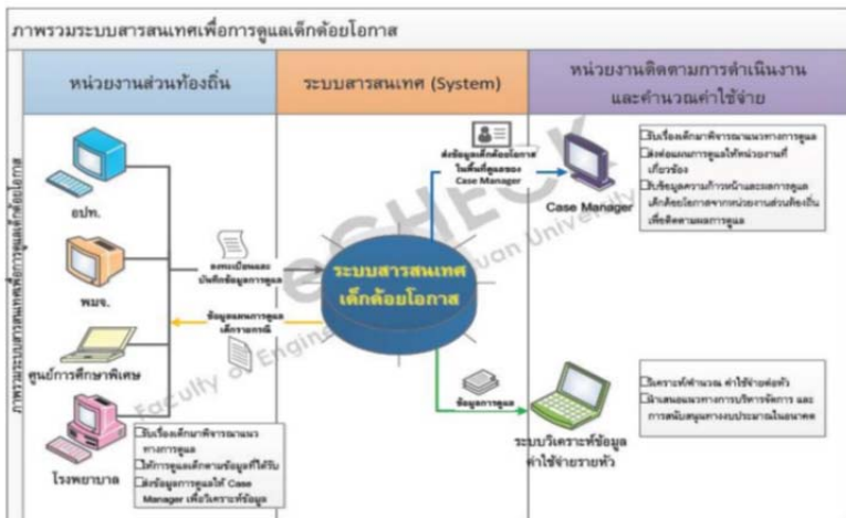
ภาพที่ ๑ ภาพรวมระบบสารสนเทศเพื่อการดูแลเด็กด้อยโอกาส

ในการทำงานของศูนย์การเรียนรู้เพื่อพัฒนาเด็กพิการและด้อยโอกาสทางการศึกษา อำเภอแม่สะเรียง หรือ "แม่สะเรียงโมเดล" ของชุดโครงการวิจัยหลักประกันโอกาสทางการศึกษา เป็นการทำงานโดยใช้ระบบฐานข้อมูลของเด็กพิการเป็นหัวใจหลักของการทำงานร่วมกับ ระบบการดูแลของครูที่ดูแลเด็กพิการในฐานะผู้จัดการดูแล (Care Manager) (ภาพที่ ๑) และมีการเชื่อมต่อกับหน่วยงานต่าง ๆ ทั้ง โรงพยาบาล ที่มีการทำงานร่วมกับแพทย์ นักกายภาพบำบัด โดยมีการทำงานร่วมกับกับองค์กรปกครองส่วนท้องถิ่น (ภาพที่ ๒) อีกทั้งหน่วยงานที่เกี่ยวข้องในการคุ้มครองและดำเนินการเพื่อเข้าถึงสิทธิในด้านต่าง ๆ ของคนพิการตามกฎหมาย (ภาพที่ ๓) ทำให้สามารถดูแลและพัฒนา รวมทั้ง การวางแผนเพื่อพัฒนาและการติดตามผลการพัฒนาเด็กพิการแบบรายบุคคลทั้งด้านพัฒนาการในด้านต่าง ๆ และด้านการประกันการเข้าถึงสิทธิของตนเองได้อย่างมีประสิทธิภาพ